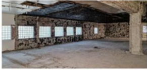
SKISSE PLASSERING JÆREN MEIERI 2024 PR APRIL 2023