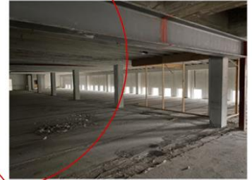
ELISE STORSVEEN MED STORE TEKSTILVERK