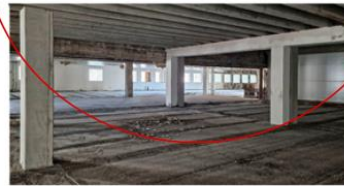
KINE LILLESTRØM MED STEDSPESIFIKK VEGG- OG GULVSKULPTUR